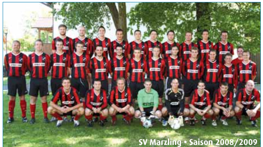
SV Marzling • Saison 2008/2009