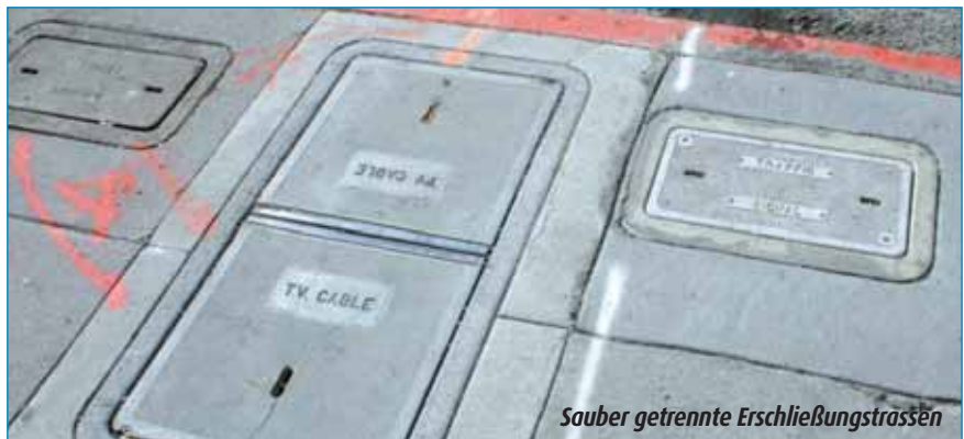
Sauber getrennte Erschließungstrassen