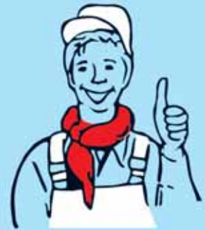
RUND UMS HAUS