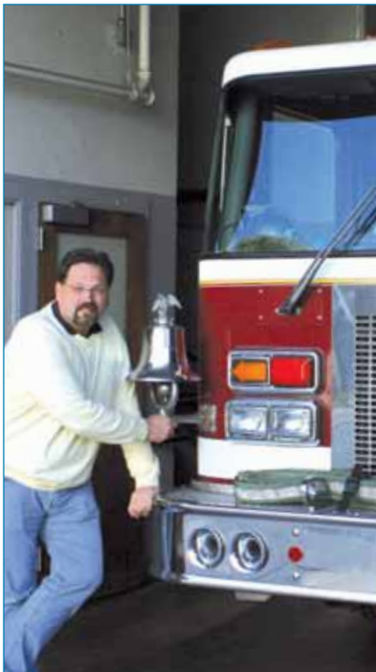
Läuten gehört hier zum Handwerk!