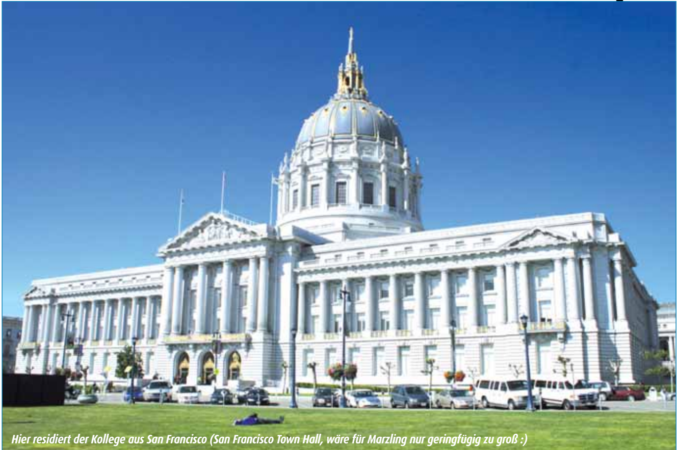
Hier residiert der Kollege aus San Francisco (San Francisco Town Hall, wäre für Marzling nur geringfügig zu groß :)