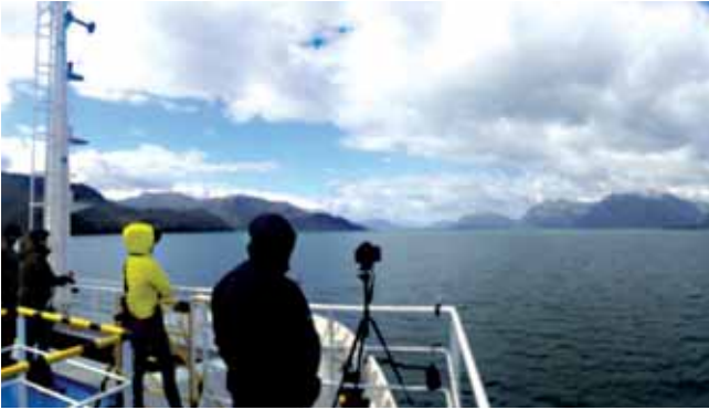
Eindrücke vom »Ende der Welt«

Ushuaia war das Wetter ziemlich wechselhaft. Von warmen bis kalten Temperaturen und von Sonne über Regen bis hin zu Schnee war alles dabei. Dieses Wetter hat meine Aktivitäten ein wenig eingeschränkt. So habe ich leider bei Weitem nicht alles gesehen, was ich mir vorgenommen hatte. Aber den Besuch im Nationalpark »Feuer-