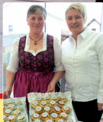
Der Marzlinger Frauenbund