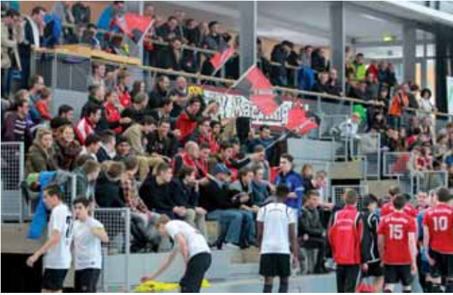
Die imposante Marzlinger »Fankurve«