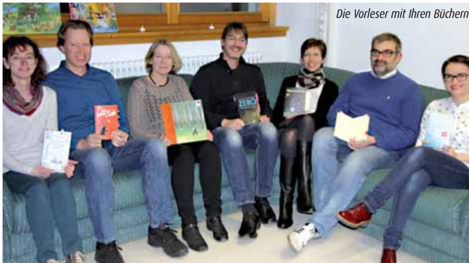
Die Vorleser mit Ihren Büchern

H ierzu hatte jeder Vorleser rund zehn Minuten Zeit, um das Buch und den Autor kurz vorzustellen und Leseproben vorzutragen. Aufgelockert wurde der Abend zusätz-