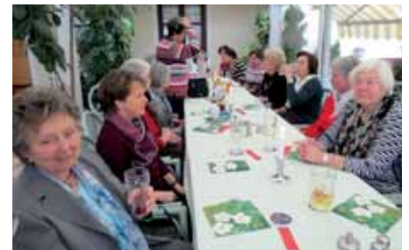
Beim Jahresauftakt im Landgasthof »Nagerl«