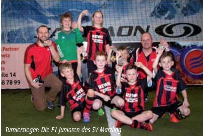
Turniersieger: Die F1 Junioren des SV Marzling