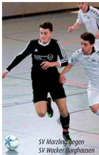
SV Marzling gegen SV Wacker Burghausen